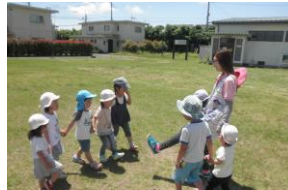
最近ブームの『はないちもんめ』日本の伝承遊びには楽しみながら自然と知能が鍛えられる遊びがたくさんあります。これからも色々な伝承遊びを楽しんでいこうと思います。