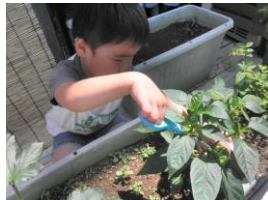
ピーマン初収穫！給食に出てくるとみんな『おいしい』とペロリと食べてしまいました。自分達で育てたお野菜はおいしいね。