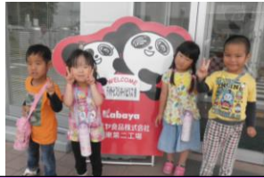
4.5歳児でカバヤお菓子工場に行ってきました。サクサクパンダの製造ラインを見学したり、おいしい試食もたくさんしてもらいました。昼食は坂東太郎でお子様セットを食べました。